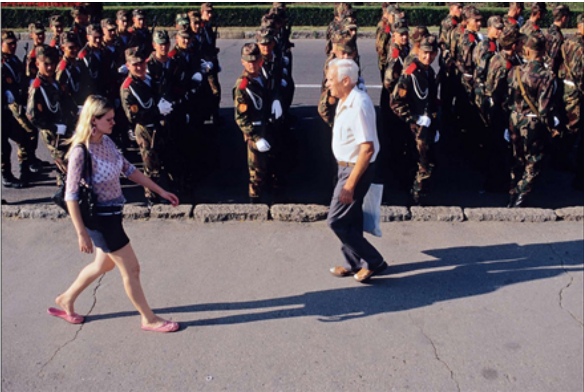
Tag der Befreiung, Parade