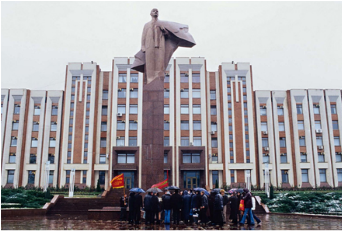
85. Jahrestag der Oktoberrevolution, Blumenniederlegung der Komsomolzen vor dem Regierungsgebäude und der Statue Lenins