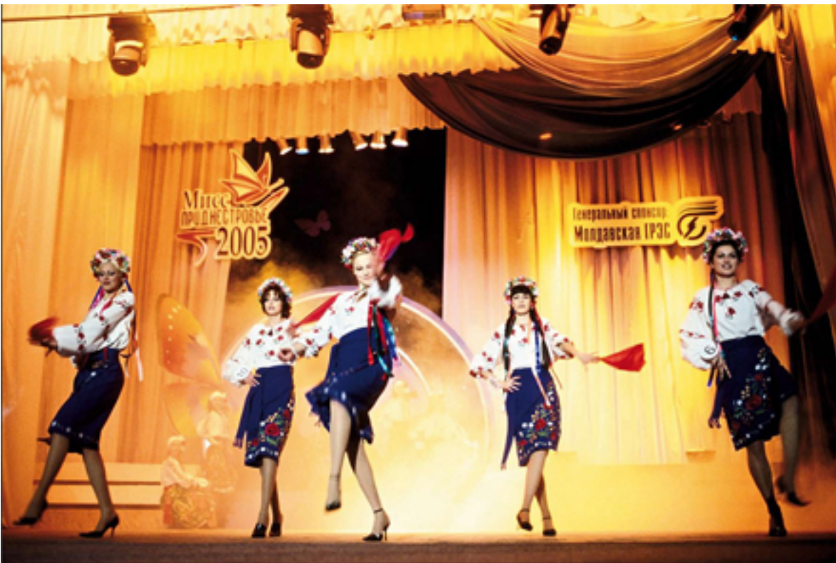
Wahl „Miss Pridnestrowien“ 2005