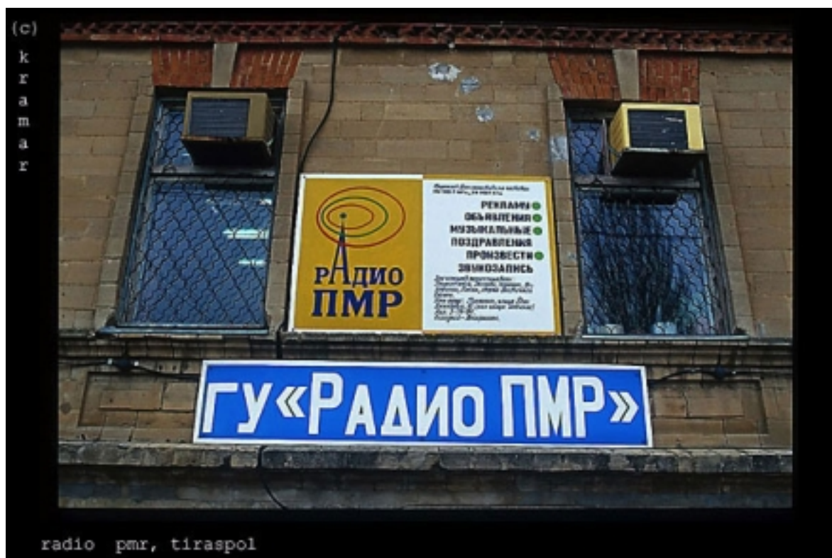
Radio PMR, Tiraspol

Kramar und Marcel Nimführ, die Autoren des Fotobands „Hier spricht Radio PMR - Nachrichten aus Transnistrien“, haben über mehrere Jahre hinweg das Land besucht, das sich seit 17 Jahren behauptet und von der internationalen Staatengemeinschaft noch immer nicht anerkannt wird. Sie haben die unterschiedlichsten Menschen kennengelernt, lassen einige von ihnen zu Wort kommen und geben dem Leser die einmalige Chance, einen Blick aus der Sicht seiner Bewohner auf das Land am Dnjestr zu werfen.