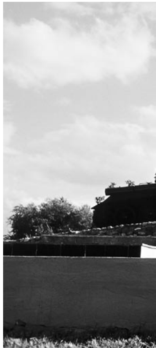
Aufputz für den großen Tag: Das Denkmal des Ruhmes

Wenn westliche Journalisten nach Transnistrien kommen (das passiert selten genug), dann bleiben ihre Augen meist an der alten sowjetischen Staffage hängen. An den großflächigen Porträts der örtlichen »Helden der Arbeit«, an den Leninfiguren, Kwas-Ständen und Panzern, vor denen sich frisch Vermählte zum obligatorischen Hochzeitsfoto aufstellen. Oder sie widmen sich den Geschichten über Schmuggler und Menschenhandel. Transnistrien gilt vielen als »schwarzes Loch«, als Paria-