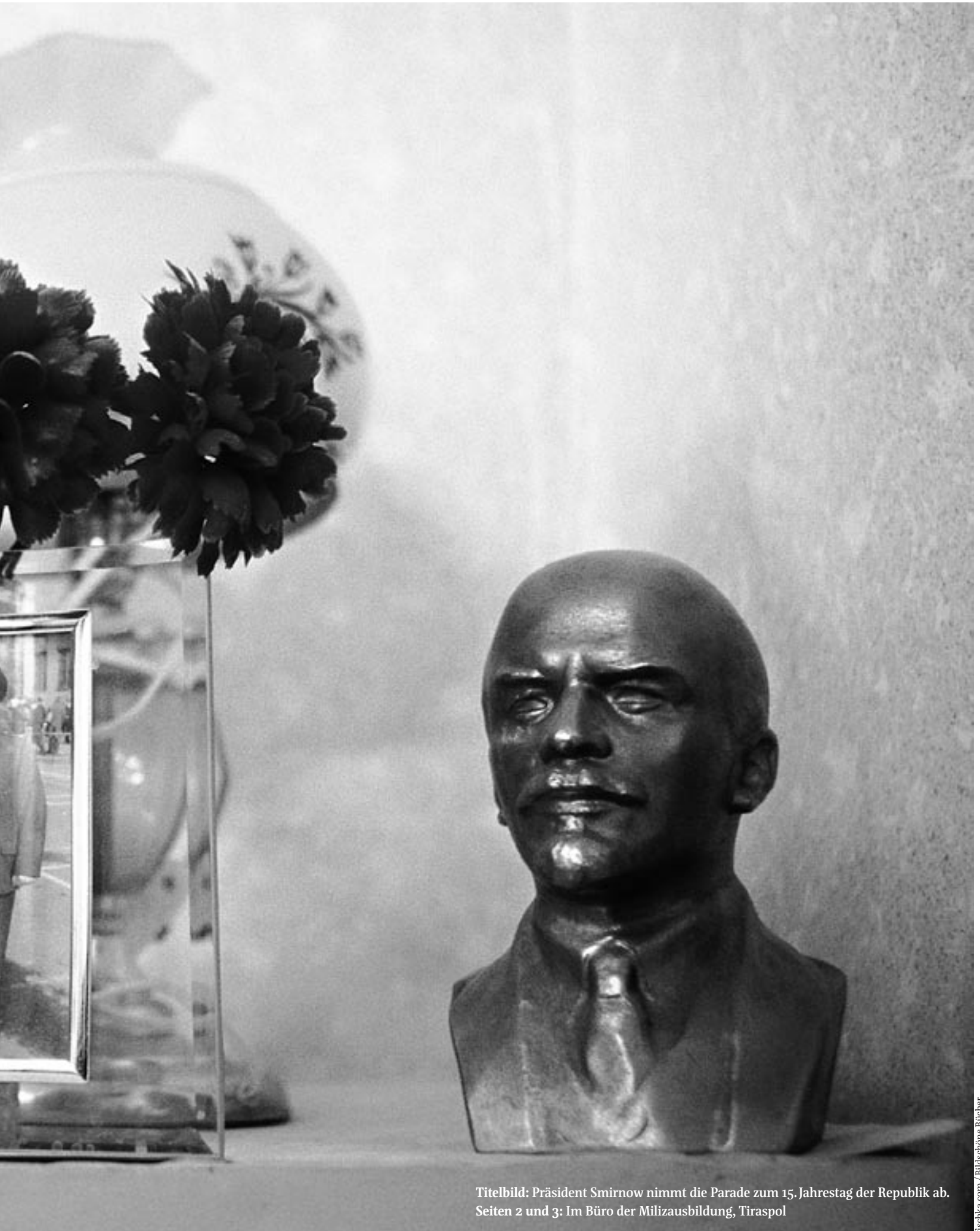
Titelbild: Präsident Smirnow nimmt die Parade zum 15. Jahrestag der Republik ab. Seiten 2 und 3: Im Büro der Milizausbildung, Tiraspol