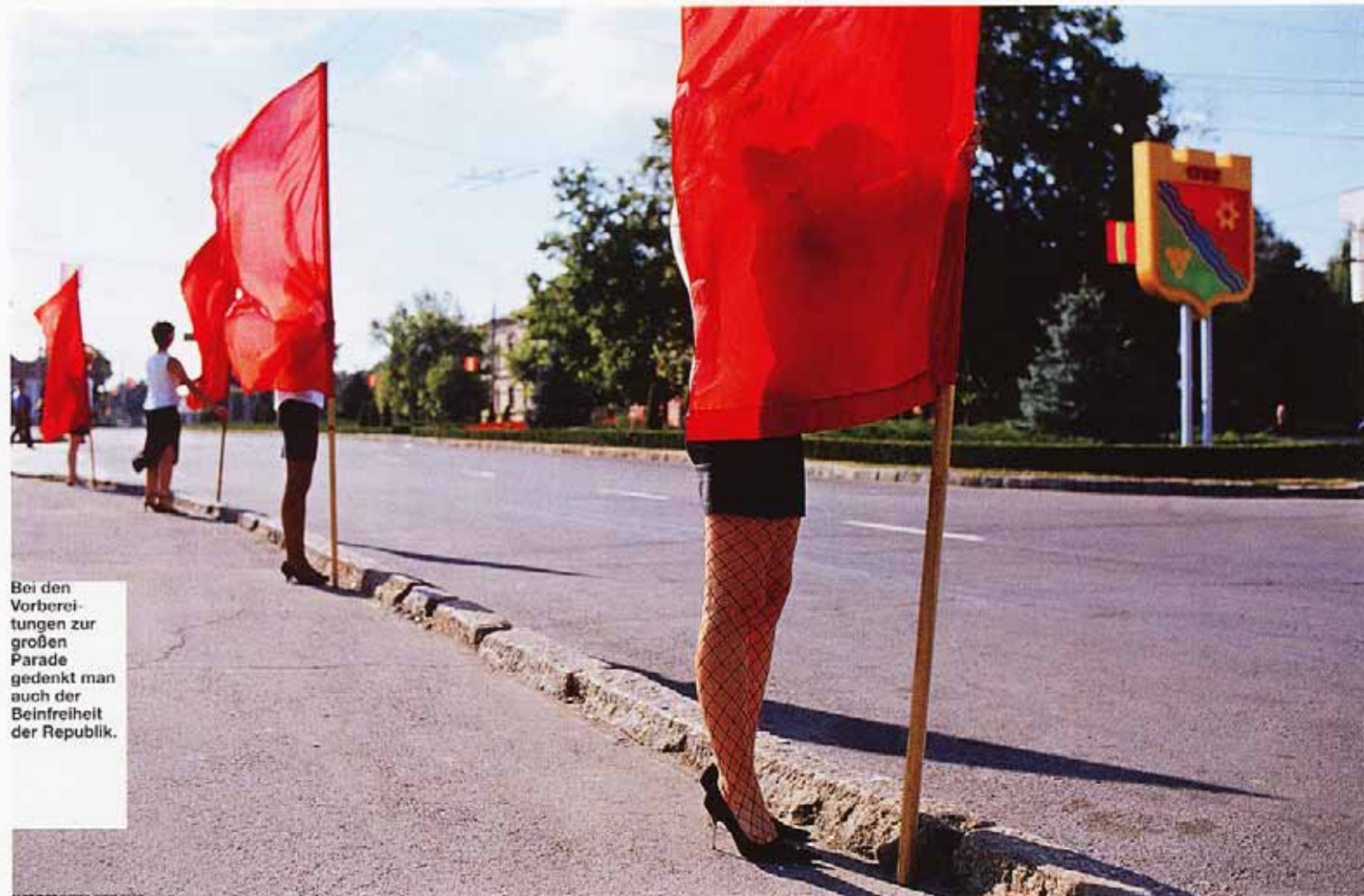
Bei den Vorbereitungen zur großen Parade gedenkt man auch der Befreiheit der Republik.

13.30 Uhr. Tiraspol, Straße des 25. Oktober. Nach einer Stunde Fahrt kommen wir in der Hauptstadt Tiraspol an. Wir fühlen uns wie in den 1970er-Jahren. Vor dem Regierungsgebäude steht eine den Platz dominierende Leninstatue.