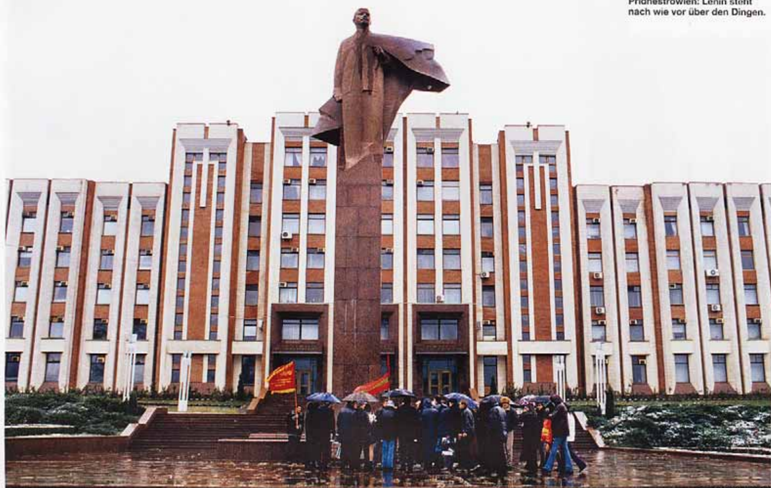
Der Säulenheilige von Pridnestrowien: Lenin steht nach wie vor über den Dingen.