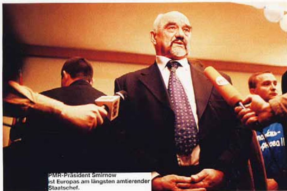
PMR-Präsident Smirnov ist Europas am längsten amtierender Staatschef.

„Ja, wir leben in schwierigen Zeiten, die Wünsche müssen sich an die Möglichkeiten anpassen“, meint Woinow. „Aber immerhin hat der Präsident uns die Instrumente gestiftet.“