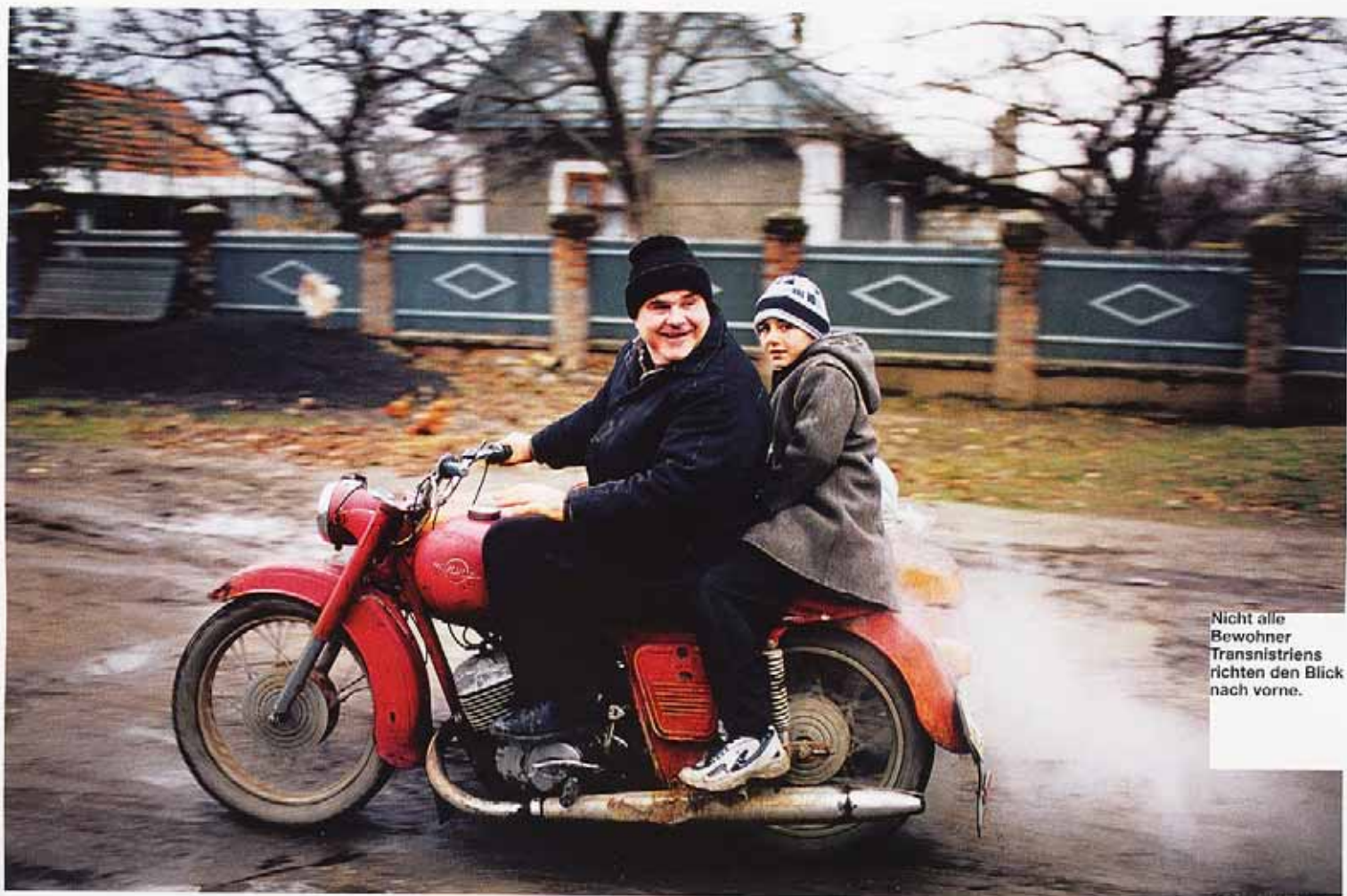
Nicht alle Bewohner Transnistriens richten den Blick nach vorne.

Pridnestrowien ist allerdings weit von einer Supermacht entfernt. Es hat die Größe Burgenlands und beherbergt 550.000 Einwohner. Es gibt Industrie mit Exportproblemen, Agrarwirtschaft, die keinen Markt findet, und eine Provinzhauptstadt, deren öffentliches Leben sich um Feierlichkeiten mit sowjetischer Nostalgie dreht: Feier zum Sieg über Nazi-deutschland im Großen Vaterländischen Krieg am 9. Mai, Jahrestag der Oktoberrevolution von 1917, Tag der Frauen >