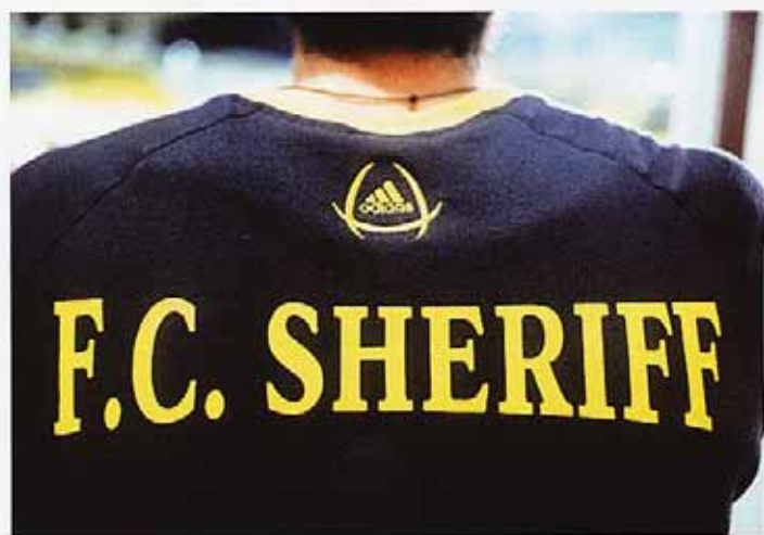
Der FC Sheriff mischt sogar in der Champions-League-Qualifikation mit.